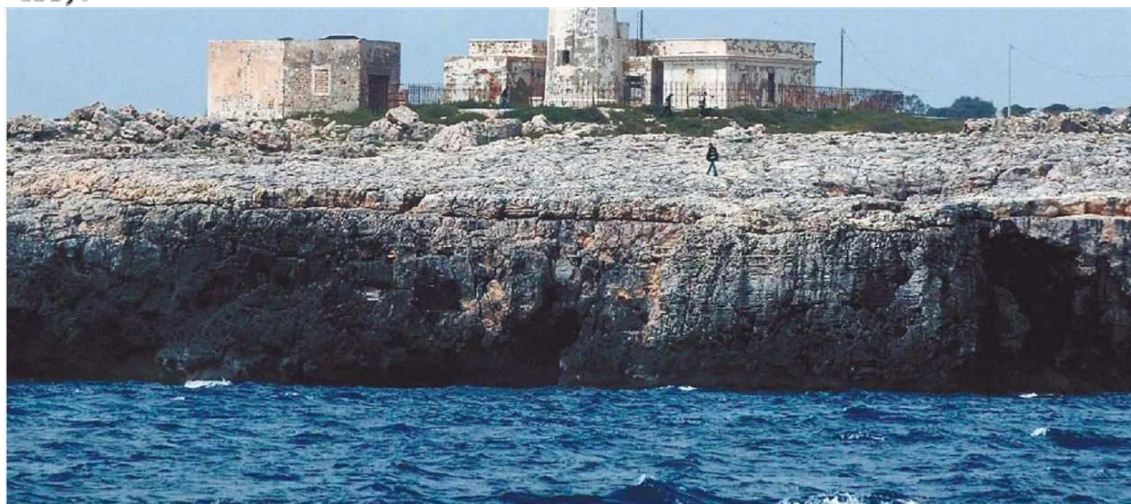
Il faro di Murro di Porco

sformazione sarà resa possibile dal progetto dell'Agenzia del Demanio per la concessione ad investitori privati di 11 fari che potrebbero rinascere proprio come nuovi alberghi turistici all'insegna della natura, della cultura e dell'ambiente, oltre che del lusso. L'operazione coinvolge alcuni dei più begli avamposti tra terra e mare delle Regioni del Centro-Sud, dalla Toscana alla Puglia, dalla Campania alla Sicilia. La lista dei fari pronti ad essere dati in concessione è infatti lunga: si va dal Faro di Brucoli ad Augusta (in provincia di Siracusa) a quello di Murro di Porco a Siracusa, da Capo Grosso nell'Isola di Levanzo (Trapani) a Punta Cavazzi ad Ustica, da Capo d'Orso a Maiori (Salerno) al Faro di Punta Imperatore a Forio d'Ischia (Napoli), fino a quello di San Domino alle Isole Tremiti (Foggia). A questi si aggiungono 4 fari messi a disposizione dal ministero della Difesa: due sull'Isola del Giglio, Punta del Fenaio e Capel Rosso, uno alle Isole Formiche (Grosseto) e quello di Capo Rizzuto (Crotona).